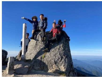
山頂のテッペンに乗る