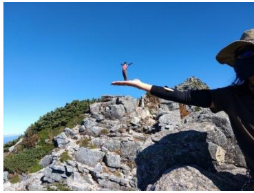
手のひらに妖精🧚🏻 浮いてる