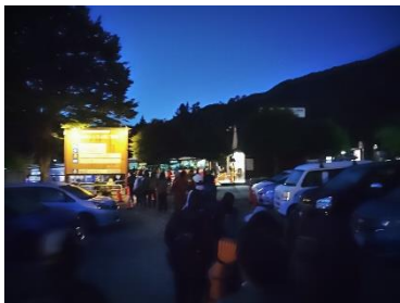
4時のチケット売り場 500人以上の列