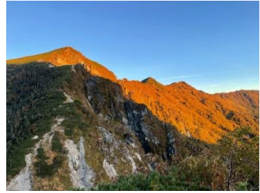
熊沢岳以北のモルゲンロート