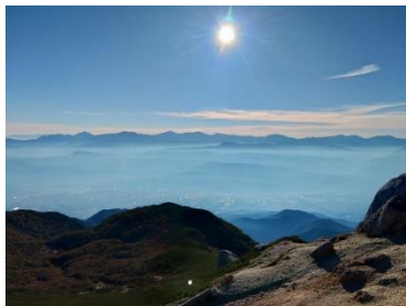
千畳敷ホテル裏から南アルプス