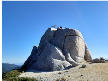
おどるポンポコリン